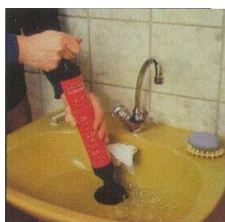
ROPUMP устраняет засоры в раковинах