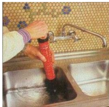
ROPUMP устраняет засоры в мойках