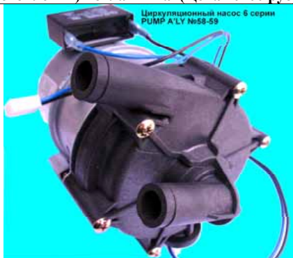
Циркуляционный насос 6 серии PUMP A'LY №58-59