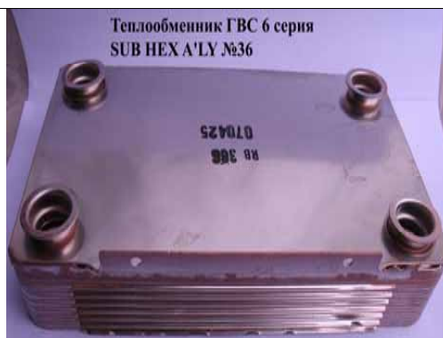
Теплообменник ГВС 6 серия SUB HEX A'LY №36