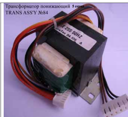
Трансформатор понижающий 5 серия TRANS ASS'Y №84