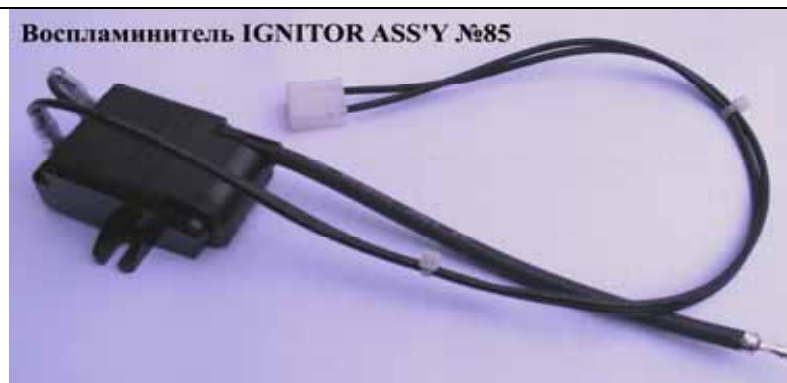
Воспламинитель IGNITOR ASS'Y №85