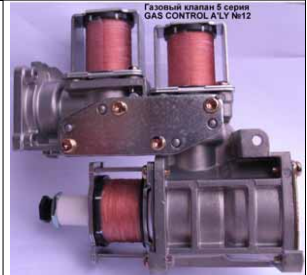
Газовый клапан котла Rinnai 5 сер (Цена 3060 руб)