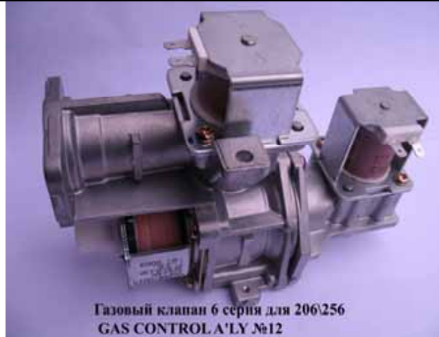
Газовый клапан котла Rinnai 6 серия (Цена 3060 руб)