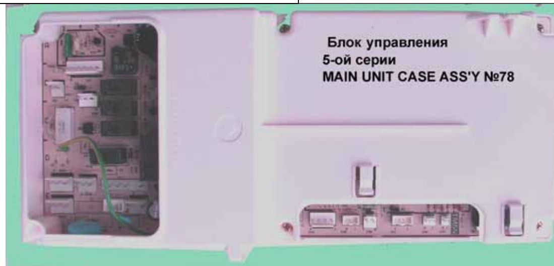
Блок управления 5-ой серии MAIN UNIT CASE ASS'Y №78

Электронный блок управления Rinnai 6 серии (Цена 6375 руб)