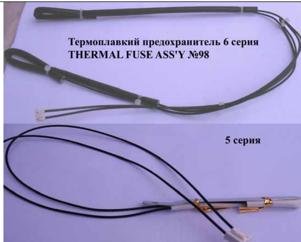
Термоплавкий предохранитель 6 серия THERMAL FUSE ASS'Y №98