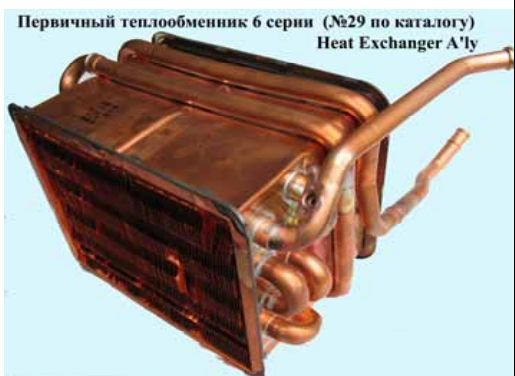
Первичный теплообменник 6 серии (№29 по каталогу) Heat Exchanger A'ly