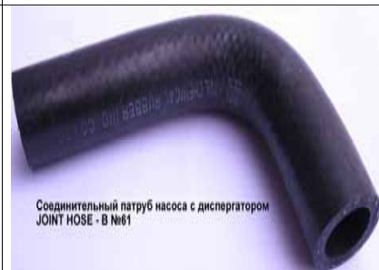
Соединительный патруб насоса с диспергатором JOINT HOSE - B №61