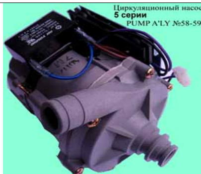
Циркуляционный насос 5 серии PUMP A'LY №58-59