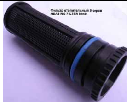
Фильтр отопительный котлов Rinnai 6 серии (Цена 242 руб)