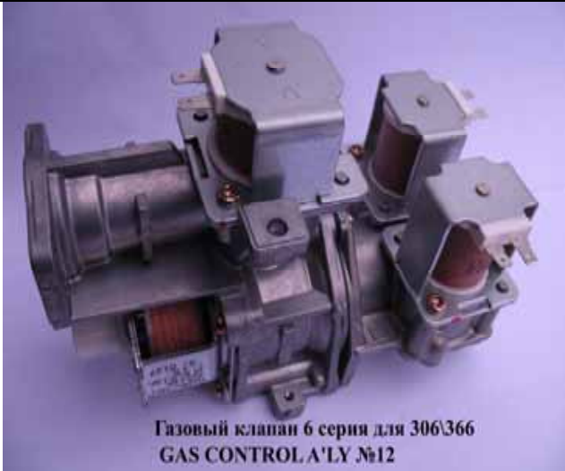
Газовый клапан котла Rinnai 6 серия (Цена 3060 руб)