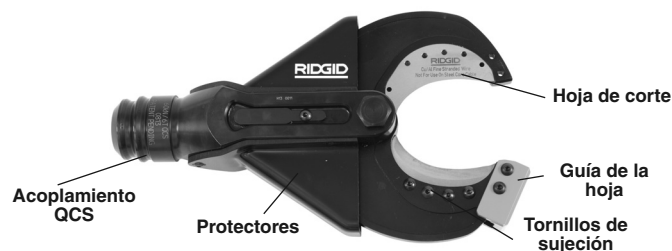
Figura 1 – Cabezal cortador tipo tijera SC-60B

El cabezal SC-60B acepta piezas cortantes reemplazables, que se pueden cambiar para cortar alambre de hilo múltiple Copper Flex. El cabezal cortador tipo tijera SC-60B se conecta con las herramientas eléctricas RIDGID o ILSCO; gracias al acoplamiento QCS™ de cambio rápido, puede rotar en 360 grados.