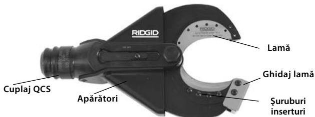
Figura 1 – SC-60B Cap de tăiere foarfecă

Capul de tăiere foarfecă SC-60B acceptă inserturi de tăiere înlocuibile, care pot fi înlocuite schimbate pentru a tăia cablu cablurile Copper Flex (torsadat). Capul de tăiere cu foarfecă se atașează la mașinile-unelte electrice RIDGID sau ILSCO și se poate roti 360 de grade cu sistemul RIDGID de cuplare rapidă (Quick Change System™, QCS™).