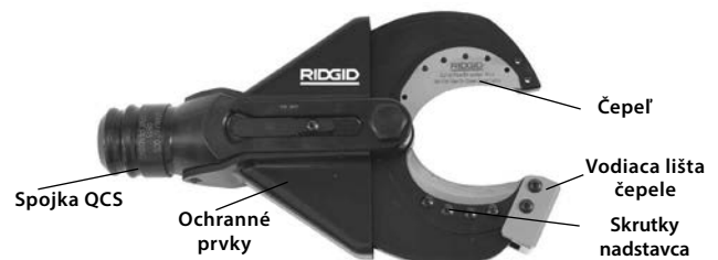
Obrázok 1 – SC-60B Nožnicová rezná hlava

Rezná hlava SC-60B je kompatibilná s vymeniteľnými reznými nadstavcami, ktoré je možné zmeniť na rezanie vodičov Copper Flex (spletených). Nožnicová rezná hlava sa pripája k RIDGID alebo ILSCO elektrickým prístrojom, ktoré sa dokážu otáčať o 360 stupňov vďaka systému rýchleho pripojenia RIDGID (QuickChange System™, QCS™).