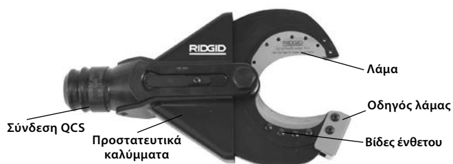
Εικόνα 1 – SC-60B Κεφαλή κόφτη τύπου ψαλιδιού

Η κεφαλή SC-60B παίρνει αντικαταστάσιμα ένθετα κοπής, που μπορούν να αλλάξουν για κοπή εύκαμπτων (πολύκλωνων) καλωδίων χαλκού. Η κεφαλή κόφτη τύπου ψαλιδιού προσαρμόζεται στα ηλεκτρικά εργαλεία RIDGID ή ILSCO και περιστρέφεται κατά 360 μοίρες με το σύστημα ταχείας σύνδεσης (QuickChange System™, QCS™) της RIDGID.