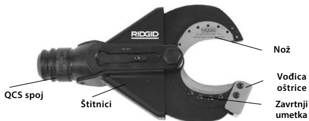
Skica 1 – SC-60B Glava sekača kablova

SC-60B može prihvatiti zamenljive pločice za sečenje koji se mogu menjati da isečete bakarne (višežilne upletene) kablove. Glava sekača kablova se pričvršćuje RIDGID ili ILSCO na električne alate i može da rotira 360 stepeni uz pomoć RIDGID sistema QuickChange System™ (QCS™).