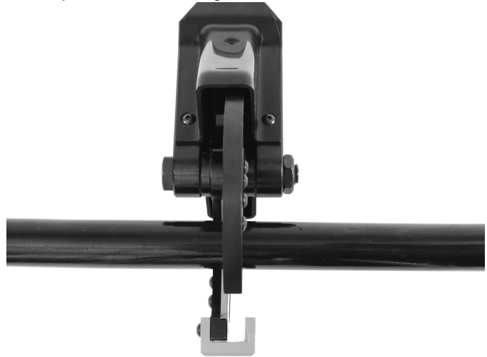
Figura 2 – Filo cortante en posición ortogonal con respecto a la marca de corte en el alambre