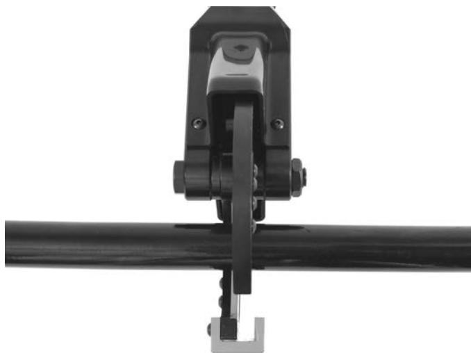
Figura 2 – Margine di taglio allineato con il contrassegno del cavo