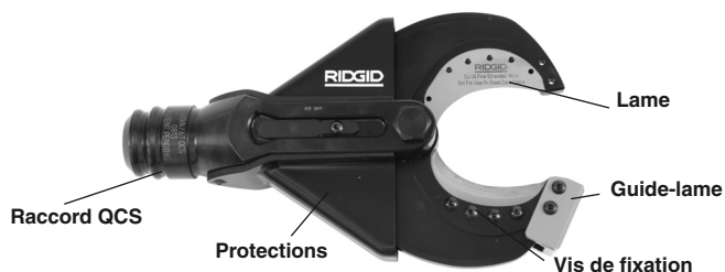
Figure 1 – Tête à cisaille SC-60B

La SC-60B peut également recevoir des lames destinées à la coupe des câbles en cuivre torsadé (Copper Flex). La tête à cisaille se monte sur une pince multifonction RIDGID ou ILSCO dont le mandrin du système de raccord rapide QCS™ lui permet de pivoter sur 360°.