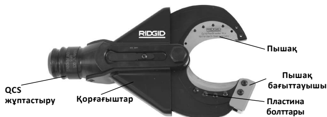
1-сурет – SC-60B Қайшы кескіш басы

SC-60B майысқақ мыс (көп желілі) сымды кесу үшін өзгертілетін ауыстырылмалы кесу пластиналарын қабылдайды. Қайшы кескіш басы RIDGID немесе ILSCO электр құралдарына тіркеледі және RIDGID QuickChange System™ (QCS™) жүйесі арқылы 360 градусқа айналуы мүмкін.