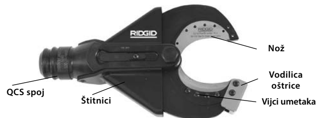
Slika 1 – SC-60B Glava za rezanje u obliku škara

SC-60B prihvaća zamjenjive umetke za rezanje, koji se mogu zamijeniti kako bi rezali Copper Flex (namotanu) žicu. Glava za rezanje u obliku škara spaja se na RIDGID ili ILSCO električne alate i može se okretati za 360 stupnjeva sa sustavom RIDGID QuickChange System™ (QCS™).