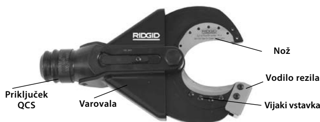
Slika 1 – SC-60B Škarjasta rezalna glava.

SC-60B sprejema izmenljive rezalne vstavke, ki jih lahko zamenjate za rezanje Copper Flex (pletene) bakrene žice. Škarjasto rezalno glavo namestite na RIDGID ali ILSCO električno orodje in jo lahko obračate za 360 stopinj s sistemom hitrega priključka RIDGID (QuickChange System™, QCS™).