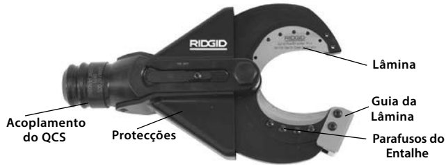
Figura 1 – SC-60B Cabeça da Tesoura de Corte