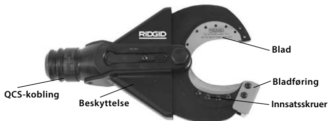
Figur 1 – SC-60B Avbiterhode

SC-60B godtar utskiftbare kutteinnsatser som kan byttes for å kutte kobberflex-ledning (trådet). Avbiterhodet festes til RIDGID eller ILSCO El-verktøy og kan rotere 360 grader med RIDGID hurtigkoblingssystem (Quick Change System™, QCS™).