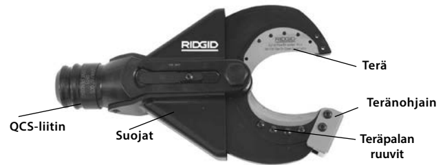
Kuva 1 – SC-60B-saksileikkuupää

SC-60B:ssä voidaan käyttää vaihdettavia teräpaloja, jotka voidaan vaihtaa joustavan Copper Flex -kuparijohdon (säikeinen) katkaisemiseen. Saksileikkuupää kiinnitetään RIDGID- tai ILSCO-sähkötyökaluihin ja sitä voidaan kääntää 360 astetta RIDGID pikaliitinjärjestelmällä (QuickChange System™, QCS™).