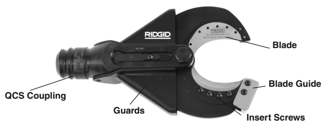
Figure 1 – SC-60B Scissor Cutter Head

The SC-60B accepts replaceable cutting inserts, which can be changed to cut Copper Flex (Stranded) wire. The Scissor Cutter Head attaches to the RIDGID or ILSCO Electrical Tools and can rotate 360 degrees with the RIDGID QuickChange System™ (QCS™).