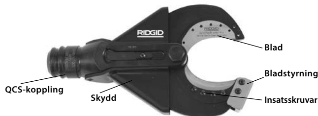
Figur 1 – SC-60B Saxkaphuvud

Modell SC-60B kan användas med utbytbara kapinsatser som kan bytas ut för att kapa flexibel kopparkabel (trådad kabel). Saxkaphuvudet fästs vid RIDGID eller ILSCO elverktyg och kan vridas 360 grader med RIDGID QuickChange System™ (QCS™).