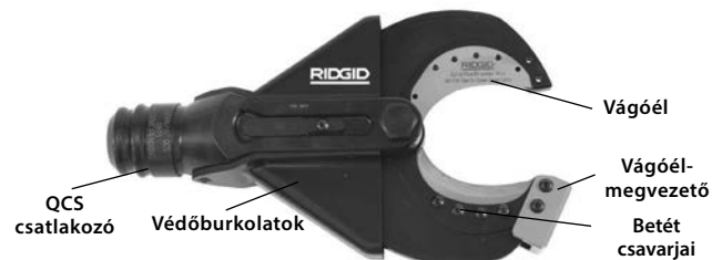
1. ábra – SC-60B ollós vágófej

Az SC-60B alkalmas a cserélhető vágóbetétek fogadására, melyek cseréjével lehetséges a sodort rézhuzalok vágása. Az ollós vágófej a RIDGID vagy ILSCO elektromos szerszámgépekhez kapcsolódik. A RIDGID QuickChange System™ (QCS™) segítségével a fej 360 fokban elforgatható.