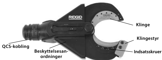
Figur 1 – SC-60B sakseskærehoved

SC-60B kan anvende udskiftelige skæreindsatser, der kan skiftes, så der kan skæres i Copper Flex (trådet). Sakseskærehovedet fastgøres til de elektriske værktøjer fra RIDGID eller ILSCO og kan rotere 360 grader med RIDGID QuickChange System™ (QCS™).