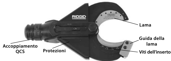
Figura 1 – SC-60B Testa da taglio a forbice

La SC-60B accetta gli inserti da taglio sostituibili, che possono essere sostituiti per tagliare i fili flessibili di rame (Filettati) Copper Flex. La Testa da taglio a forbice si collega agli Utensili elettrici RIDGID o ILSCO e può rotare di 360 gradi con il Sistema di connessione rapida QuickChange System™ (QCS™) RIDGID.