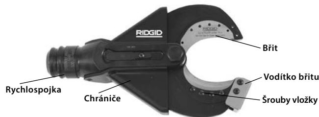
Obrázek 1 – SC-60B Stříhací hlava

U modelu SC-60B lze použít i vyměnitelné řezné vložky, které lze vyměnit pro stříhání ohebného měděného vedení (slanovaného). Stříhací hlava se připojuje k elektrickému nářadí RIDGID nebo ILSCO a může se otáčet o 360 stupňů pomocí systému rychlospojek RIDGID (Quick Change System™, QCS™).