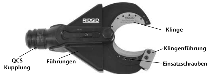
Abbildung 1 SC-60B Scherenschneidkopf

Der SC-60B nimmt auswechselbare Schneideinsätze auf, die gewechselt werden können, um Kupferlitze (verseilt) zu schneiden. Der Scherenschneidkopf wird am RIDGID oder ILSCO Elektrowerkzeug befestigt und kann mit dem RIDGID Schnellkupplungssystem (QuickChange System™, QCS™), um 360 Grad gedreht werden.