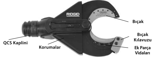
Şekil 1 - SC-60B Makas Kesici Kafası

SC-60B, Bakır Esnek (Standart) teli kesmek için değiştirilebilecek değiştirilebilir kesme sokuntularını kabul eder. Makas Kesme Başı RIDGID veya ILSCO Elektrikli Aletlerine takılır ve RIDGID QuickChange System™ (QCS™) ile 360 derece dönebilir.