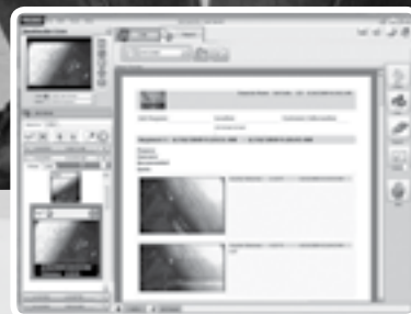
Пример отчета в SeeSnake HQ