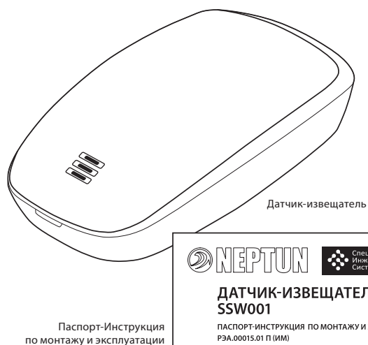
Рис. 1. Комплектация: Датчик-извещатель и Паспорт-Инструкция по монтажу и эксплуатации

ПАСПОРТ-ИНСТРУКЦИЯ ПО МОНТАЖУ И ЭКСПЛУАТАЦИИ РЭА.00015.01 П (ИМ)