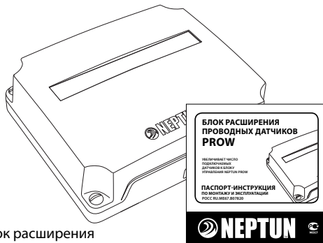
Блок расширения проводных датчиков ProW