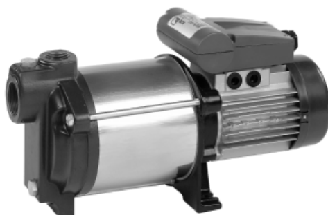
Multi Eco E и D