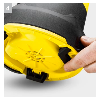
4 Складные ножки