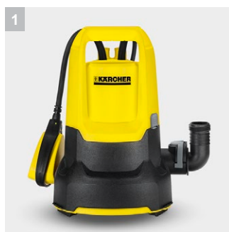
1 Керамическое уплотнительное кольцо