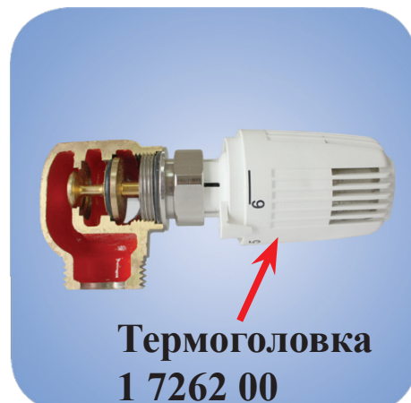
Термоголовка 1 7262 00