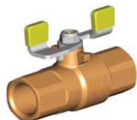
1 2300 1x