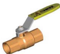
1 2300 0x