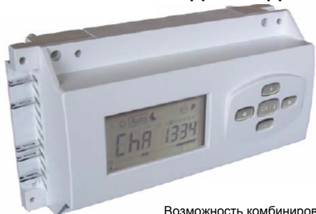
Возможность комбинирования 6 или 10-ти зон