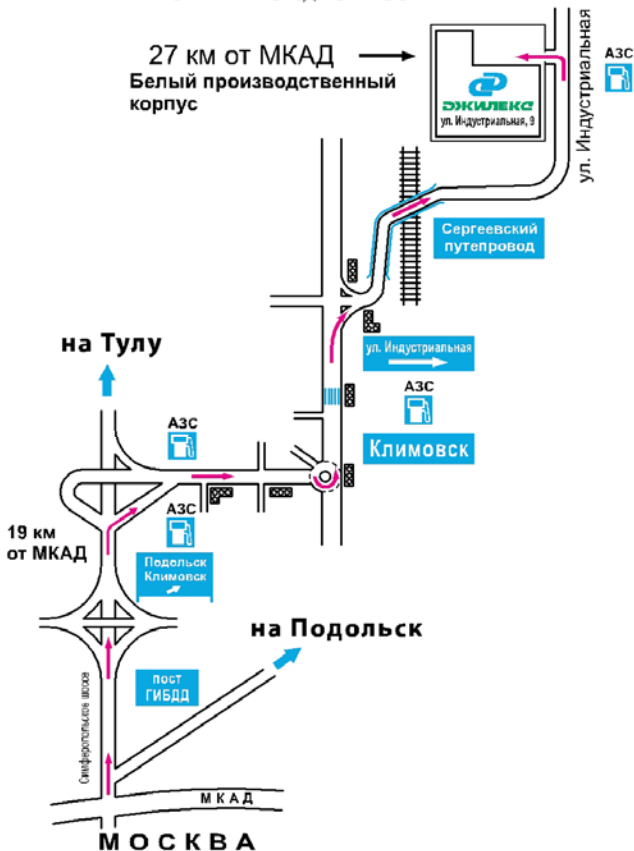
СХЕМА ПРОЕЗДА ОТ МОСКВЫ