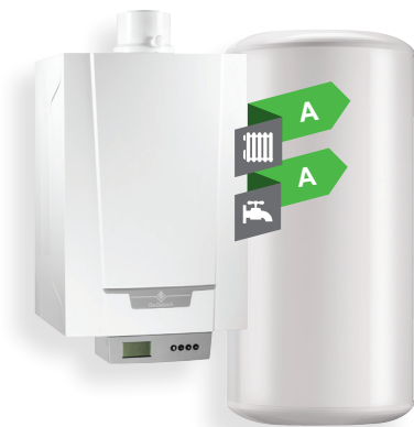
PMC-S 24/34 + BMR 80 Котёл для отопления и ГВС с водонагревателем ёмкостью 80 литров