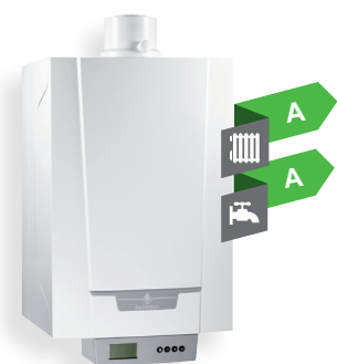
PMC-S 24/34 Котел для отопления и ГВС с переключающим клапаном PMC-S 24/28 MI PMC-S 30/35 MI PMC-S 34/39 MI Котёл для отопления и ГВС с пластинчатым теплообменником