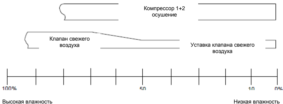
Пример ступенчатого регулирования влажности