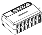
BU850E Руководство пользователя