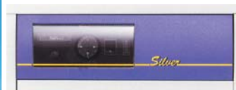
Панель управления CTC Silver BL/Silver