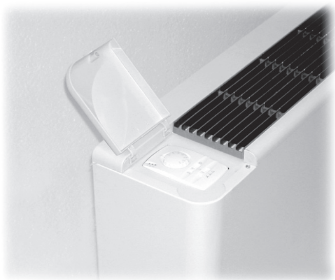
Пульт, встроенный в блок