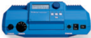
Система управления Logomatic 2000

Если вы хоть раз попытаетесь регулировать отопление с помощью системы обслуживания Logomatic 2000, Вы поймете, что мы понимаем под «простотой обслуживания». Вам не нужно изучать инструкцию по эксплуатации,