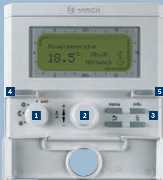
Погодозависимый контроллер FW200.