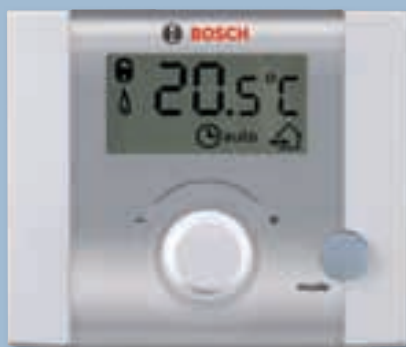
Комнатный регулятор FR 10 с ЖК-дисплеем обеспечит Вам полный контроль над системой отопления.

Данная серия регуляторов может быть встроена в котел, а может быть установлена в жилом помещении. Желательно, на самую холодную стену дома устанавливается датчик наружной температуры. Постарайтесь установить его так, чтобы избежать прямого попадания на него солнечных лучей, тепловых потоков из открытых форточек или дымовых газов из дымохода, выведенного на фасад. Далее на погодозависимом регуляторе выполняется настройка отопительной кривой и ее более точная подстройка спустя некоторое время. При этом регулятор хранит в своей памяти данные о прошедшей работе, накапливая тем самым практическую информацию о предпочтениях клиента и подстраиваясь под заданный режим работы.