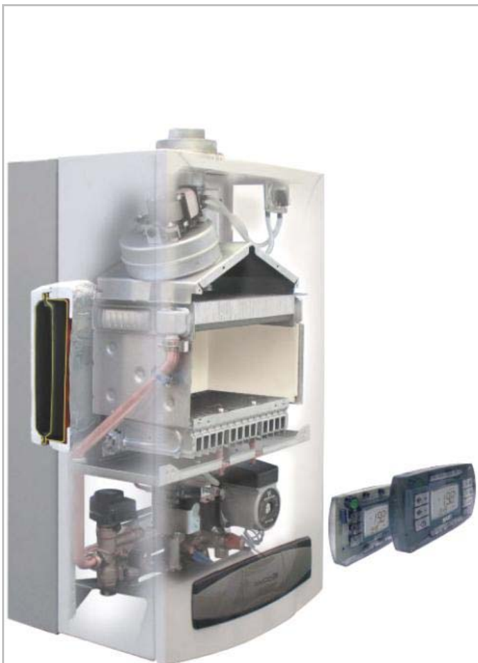
LUNA 3 COMFORT MAX