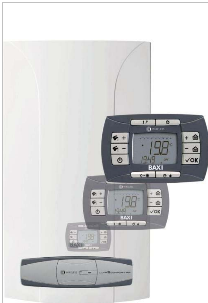
LUNA 3 COMFORT AIR