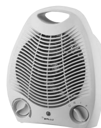
BFH - 02 220V 50Hz 2000W