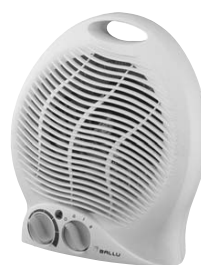
BFH - 01 220V 50Hz 2000W