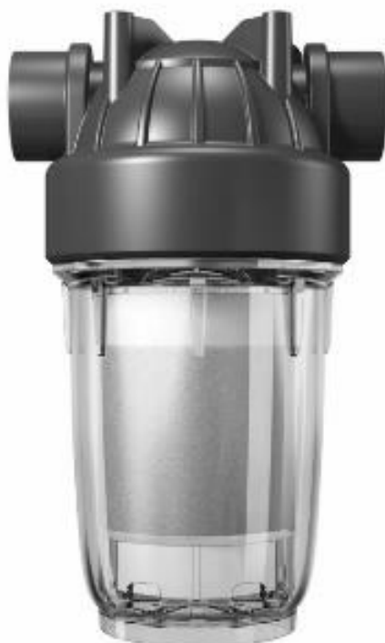
арт. 750 001