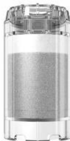
арт. 750 002