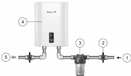
Рис.2 Схема подключения фильтра.

Внимание! Если водопровод не будет использоваться более двух суток, необходимо перекрыть общий кран подачи холодной воды на дом/квартиру.