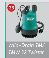
Wilo-Drain TM/ TMW 32 Twister