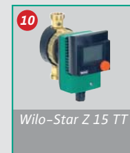
Wilo-Star Z 15 TT