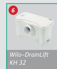
Wilo-DrainLift KH 32