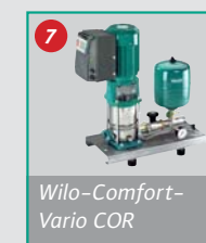
Wilo-Comfort- Vario COR