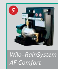
Wilo-RainSystem AF Comfort