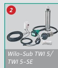
Wilo-Sub TWI 5/ TWI 5-SE