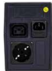
RAPAN-UPS 1500 RAPAN-UPS 2000