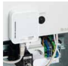
Индикация режимов работы