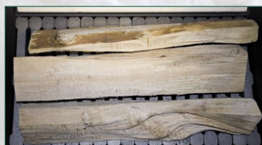
Древесина длиной 330-530 мм