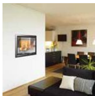
Вкладки для сжигания древесного топлива