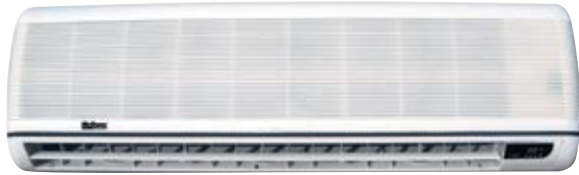
M5WM 030 FR