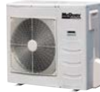
MLC 028 CR-A