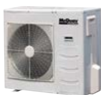
M5LC 020/025/028 CR-A