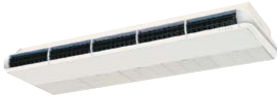
M5CM 062 CR