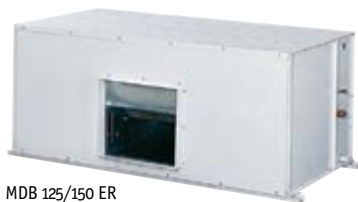
MDB 125/150 ER