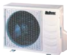
M5LC 010/015 CR