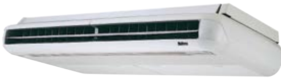
M5CM 040/050 DR