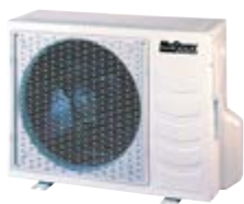
M5LC 015 CR