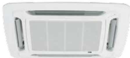
M5CK 020/025/028/040/050 ER