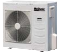
MLC 020/025 CR