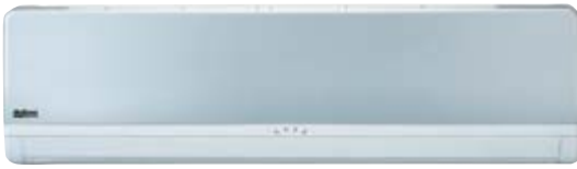
M5WM 007/010/020/025 G2R