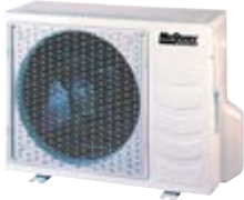
MLC 010/015 CR