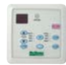
МС301 для МСС (стандартно)