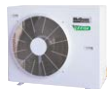
M5LC 040/050 DR-F