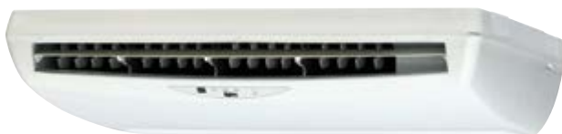
M5CM 015/020/025/028/035/040 ER