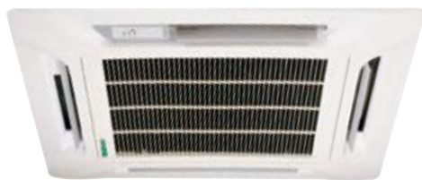
M5CK 010/015/020 CR