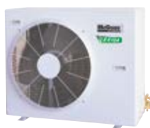
M5LC 040/050/061 DR-F

Бытовые и полупромышленные системы кондиционирования