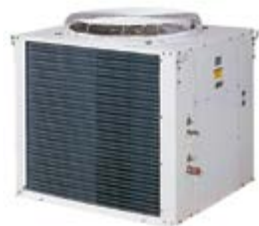
MMC 075/150 ER