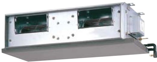
M5CC 015/020/025/028/038/050/060 CR