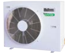
M5LC 040/050/061 DR-F