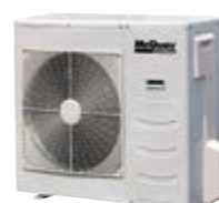
M5LC 020/025/028 CR-A