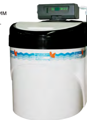
JUDO EASY SOFT 15S Установка умягчения