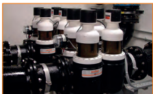
Фильтрация питьевой воды с помощью JPF-ATP DN 200. Казино город мечты, Китай