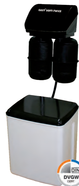
JUDO EASY SOFT TWICE Установка умягчения в параллельном режиме