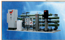
Установка обратного осмоса для охлаждения в вычислительном центре, Германия