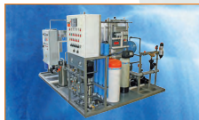
Установка для сверхчистой воды для больницы, Германия