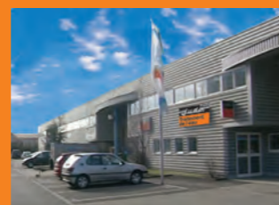
JUDO Франция Страсбург