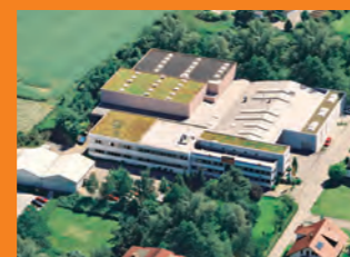
Научно-технический центр / Производство Бакнанг, Германия