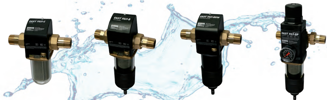
Жидкостный фильтр JUDO EASY FILT-C