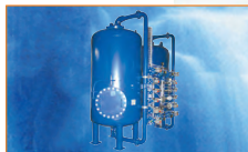
Установка умягчения для больницы, Швейцария