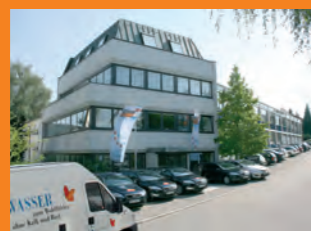
Главный офис / учебный центр Винненден, Германия

Вы также можете извлечь для себя пользу с помощью наших многолетних знаний продаж и технического опыта.