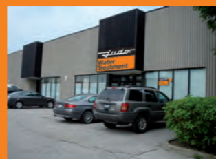
JUDO Канада Торонто