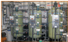
Установка обезжелезования для воды из скважины. Молочный завод, Берлин