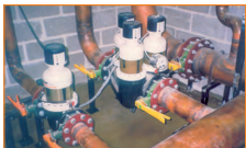
Фильтрация питьевой воды с помощью JPF-ATP DN 100 и DN 150. Олимпийская деревня, Сидней