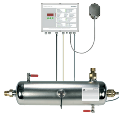
Облучение ультрафиолетом с помощью установки GENO®-UV