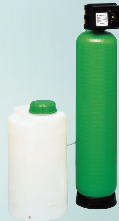
Фильтровальная установка GENO-mat®

Grünbeck меняет взгляд на вещи. И обеспечивает чистой водой новейшими ресурсосберегающими методами. В зависимости от засыпки фильтра из воды удаляются частицы грязи, железа и марганца. С помощью обратной промывки все загрязняющие воду вещества смываются в канализацию. Засыпка фильтра с активированным углем способствует удалению хлора из воды и улучшает вкус и запах. Как частный потребитель, Вы сможете наслаждаться чистой водой, освежающей и приятной на вкус. Эти преимущества касаются и ваших бытовых приборов. Потому что, где течет чистая вода, то там и трубы не засоряются.