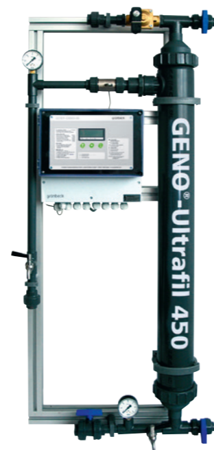
Ультрафильтрация с помощью установки GENO®-Ultrafil

Вода означает качество жизни до тех пор, пока она не заражена бактериями. Для частной водоподготовки легко можно сделать дезинфекцию воды с помощью новейших технологий от Grünbeck. Вы можете выбрать одну из трех технологий на выбор. Все технологии работают эффективно даже с малыми установками и позволяют достигать надежной дезинфекции. И у Вас автоматически возникает так называемое чувство Грюнбека. Это чувство уверенности, что Вы сделали самое лучшее для качества Вашей воды. А тем самым для здоровья Вашей семьи .