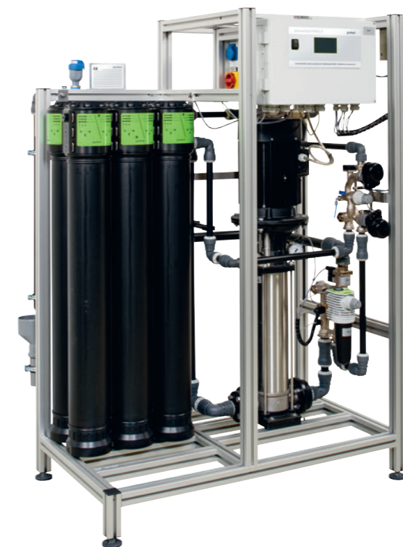
Селектор ионов NANO-X

Питьевая вода должна соответствовать строгим предписаниям. И это правильно. Только благодаря нормам мы можем защитить наше здоровье, а также обеспечить сохранность техники и водопроводных систем. Поэтому на Grünbeck придается большое значение первоклассной технике – нанофильтрации – для частичного обессоливания и частичного умягчения. Из воды удаляются излишки сульфатов, хлоридов и фтора и, таким образом, полученная вода удовлетворяет всем требованиям и предписаниям соответствующих органов. Технология также применима для малых установок, обеспечивает высокое качество жизни и устанавливает масштабы в области продолжительности срока службы.