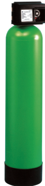
Установка снижения кислотности GENO-mat® TE-Z

Вода с низким уровнем pH является чистой и не вредит здоровью. Но она может вызывать повреждение труб и, тем самым, дорогие ремонтные работы. Grünbeck поможет Вам осуществить надежную защиту. Две надежных технологии позволяют значительно повысить уровень pH и, тем самым, надежно защитить ваши водопроводные системы. Таким образом вы гарантируете себе эффективное снижение кислотности. Одновременно с этим Grünbeck гарантирует также долгосрочность службы оборудования для вашего водоснабжения. И это Вам окупится.