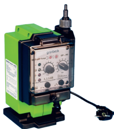
Дозирование с помощью насоса GENODOS®-GP