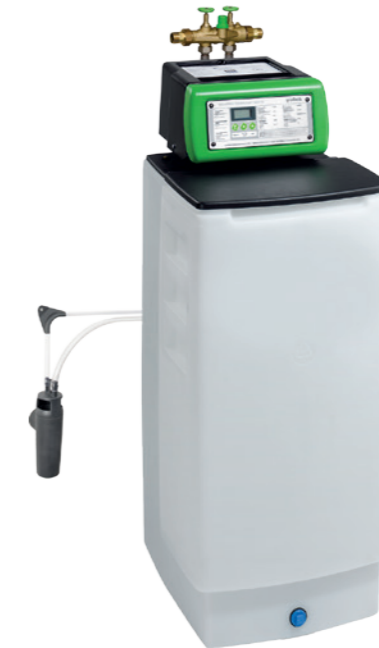
Установка фильтрации нитратов WINNI-mat® VGX-N

Мы считаем, что даже в регионах с сильным загрязнением от удобрений, люди имеют право на чистую и безопасную воду. Поэтому мы разработали решения также и для этих ситуаций: Ионообменники: Избыточное содержание нитратов меняется на безопасный хлорид. При исчерпывании ионообменника, происходит автоматическая обратная промывка. Таким образом ионообменники от Grünbeck обеспечивают качественную питьевую воду.