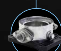
Овальный фланец AISI 304 AISI 316L