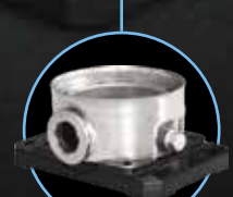
Зажим AISI 304 AISI 316L