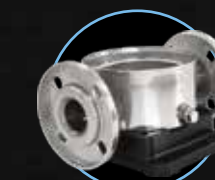
Круглый фланец AISI 304 AISI 316L