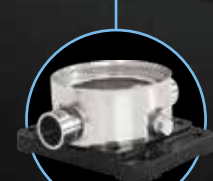
Victaulic® AISI 304 AISI 316L