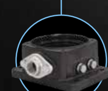
Овальный фланец ЧУГУН