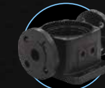
Круглый фланец ЧУГУН