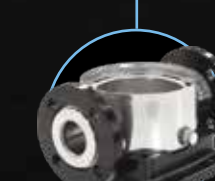
Свободный круглый фланец ASTM CF8