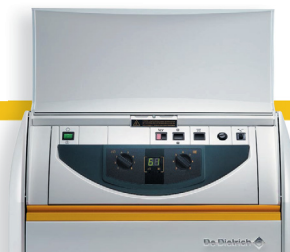
Базовая панель управления