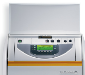
Панель управления Diematic 3