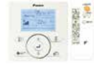
BRC1E52A/B (опция) BRC7C58 (опция)