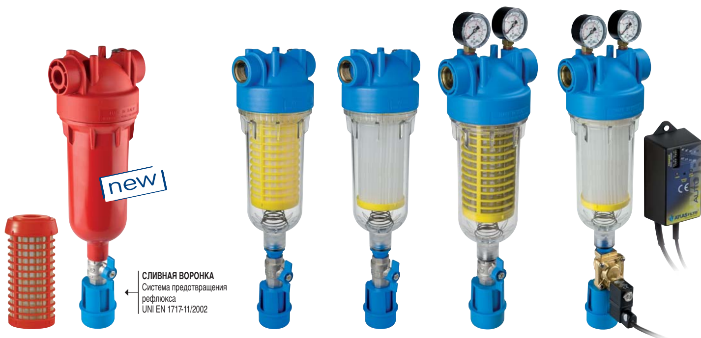
СЛИВНАЯ ВОРОНКА Система предотвращения рефлюкса UNI EN 1717-11/2002