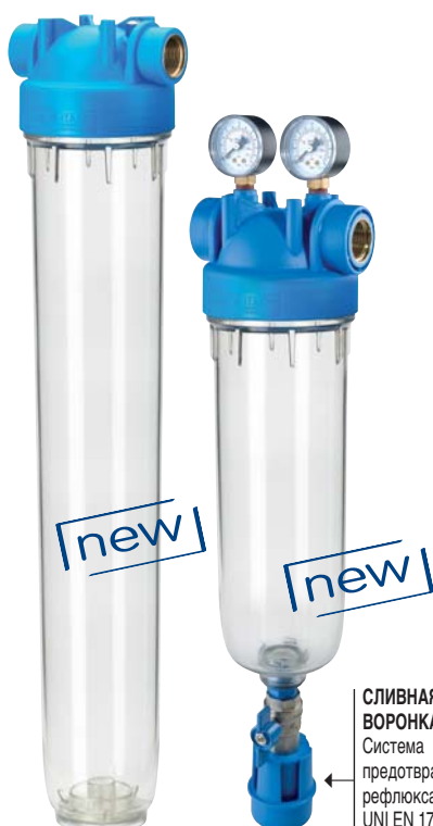
СЛИВНАЯ ВОРОНКА Система предотвращения рефлюкса UNI EN 1717-11/2002