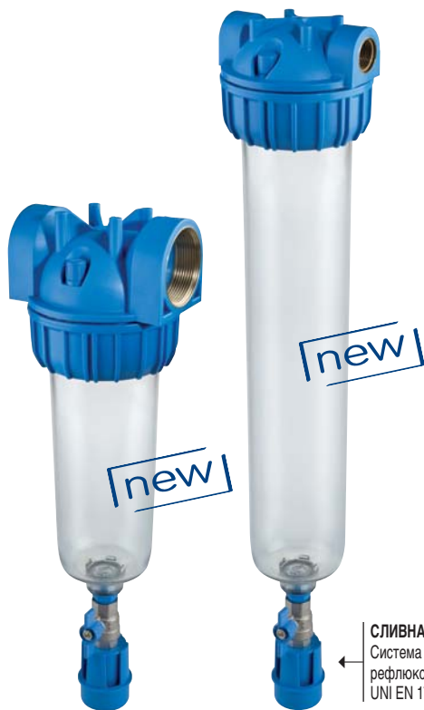
СЛИВНАЯ ВОРОНКА Система предотвращения рефлюкса UNI EN 1717-11/2002