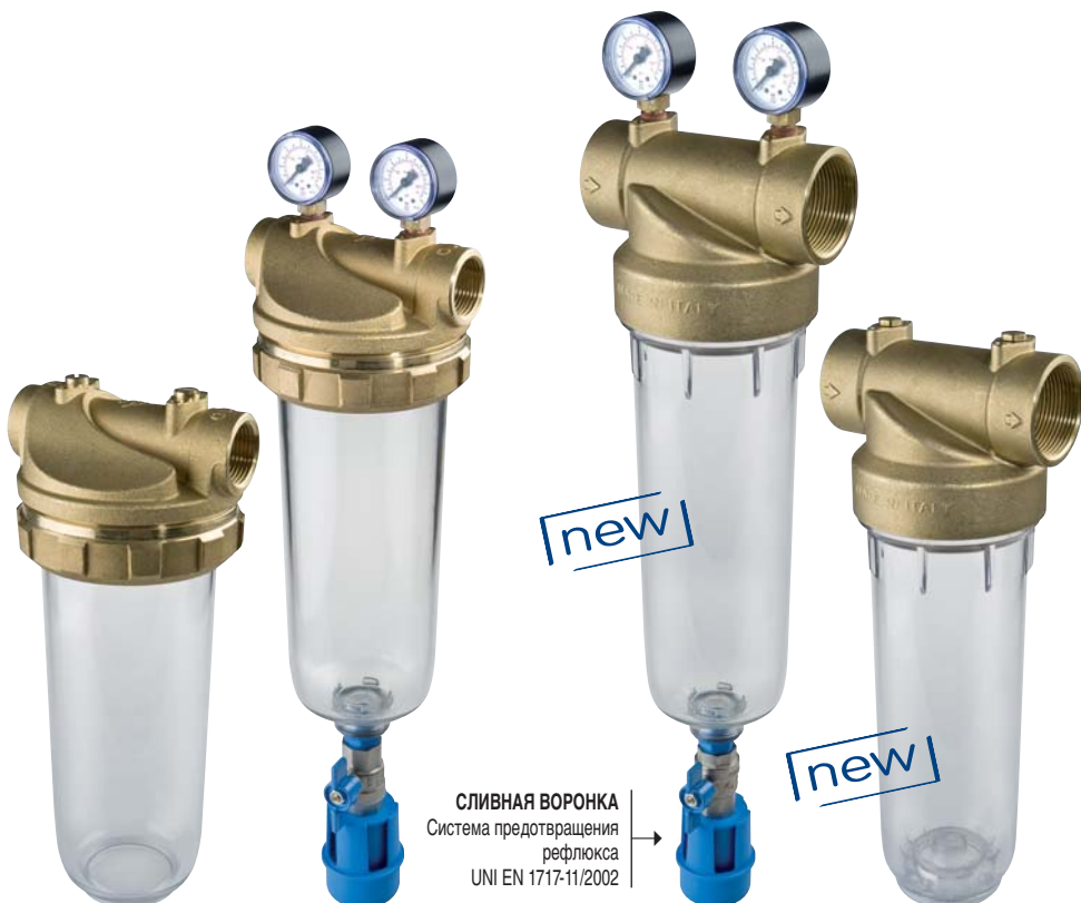
СЛИВНАЯ ВОРОНКА → Система предотвращения рефлюкса UNI EN 1717-11/2002

Основные материалы: латунь CW 614 N, ПЭТ.