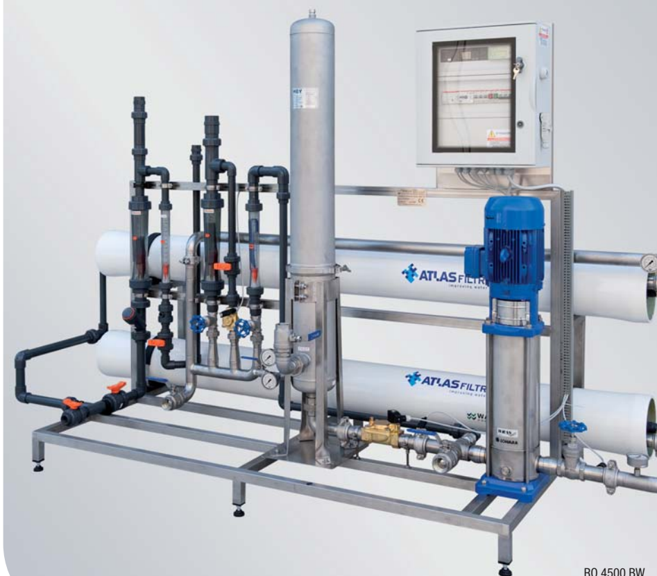
RO 4500 BW Солоноватая вода Производительность проницания - 4500 л/ч