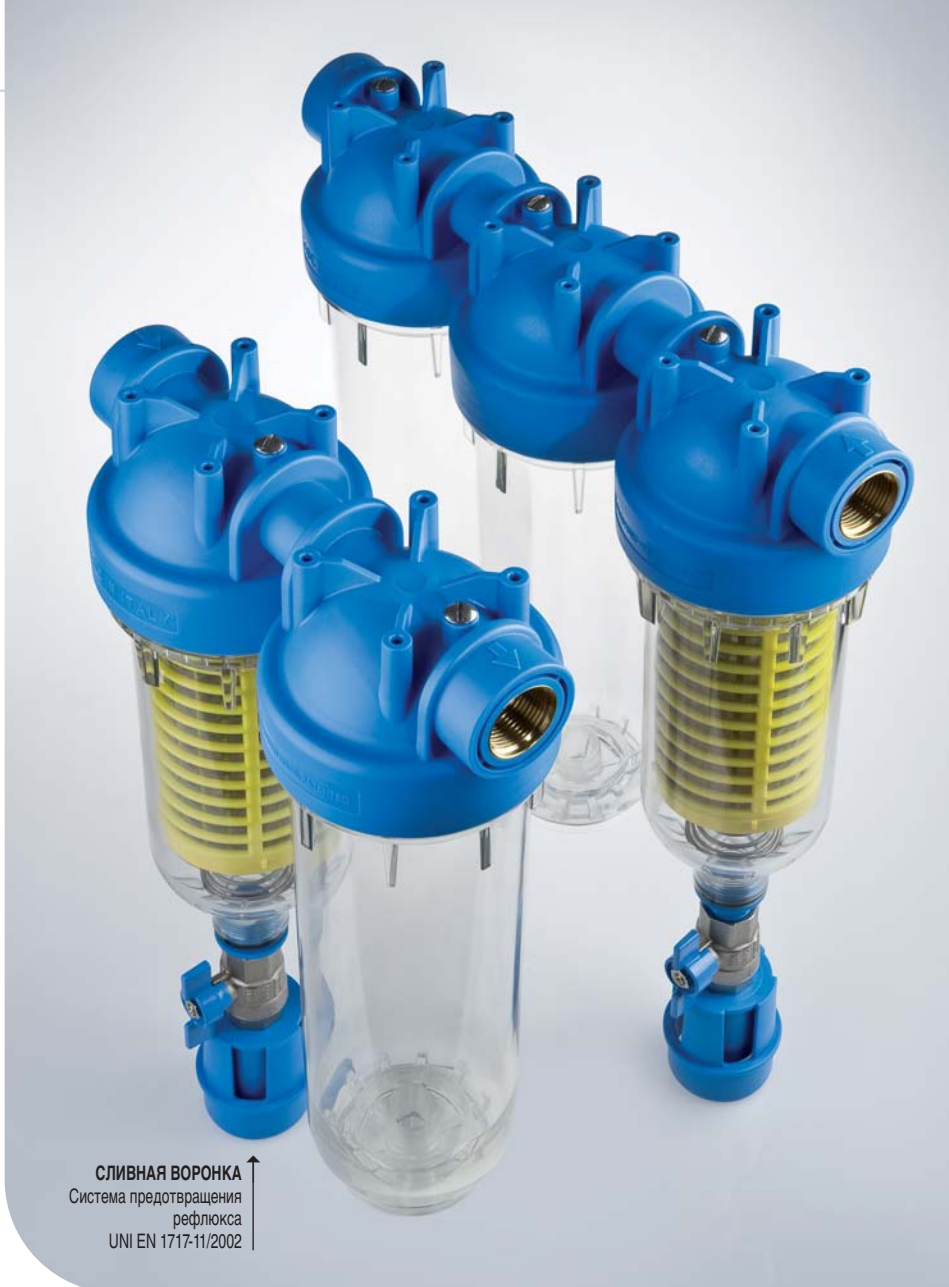
СЛИВНАЯ ВОРОНКА ↑ Система предотвращения рефлюкса UNI EN 1717-11/2002