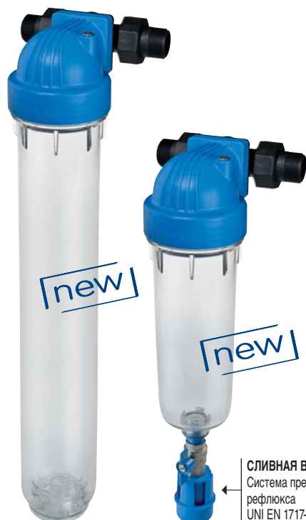
СЛИВНАЯ ВОРОНКА Система предотвращения рефлюкса UNI EN 1717-11/2002