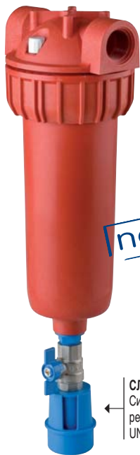
СЛИВНАЯ ВОРОНКА Система предотвращения рефлюкса UNI EN 1717-11/2002

Для картриджей SX с плоскими стандартными уплотнениями (DOE). Патрубки ВХ./ВЫХ. размером 1/2", 3/4", 1", с цилиндрической резьбой (BSP) из пластика; модели с конической резьбой (NPT) из пластика размером 3/4" и 1".