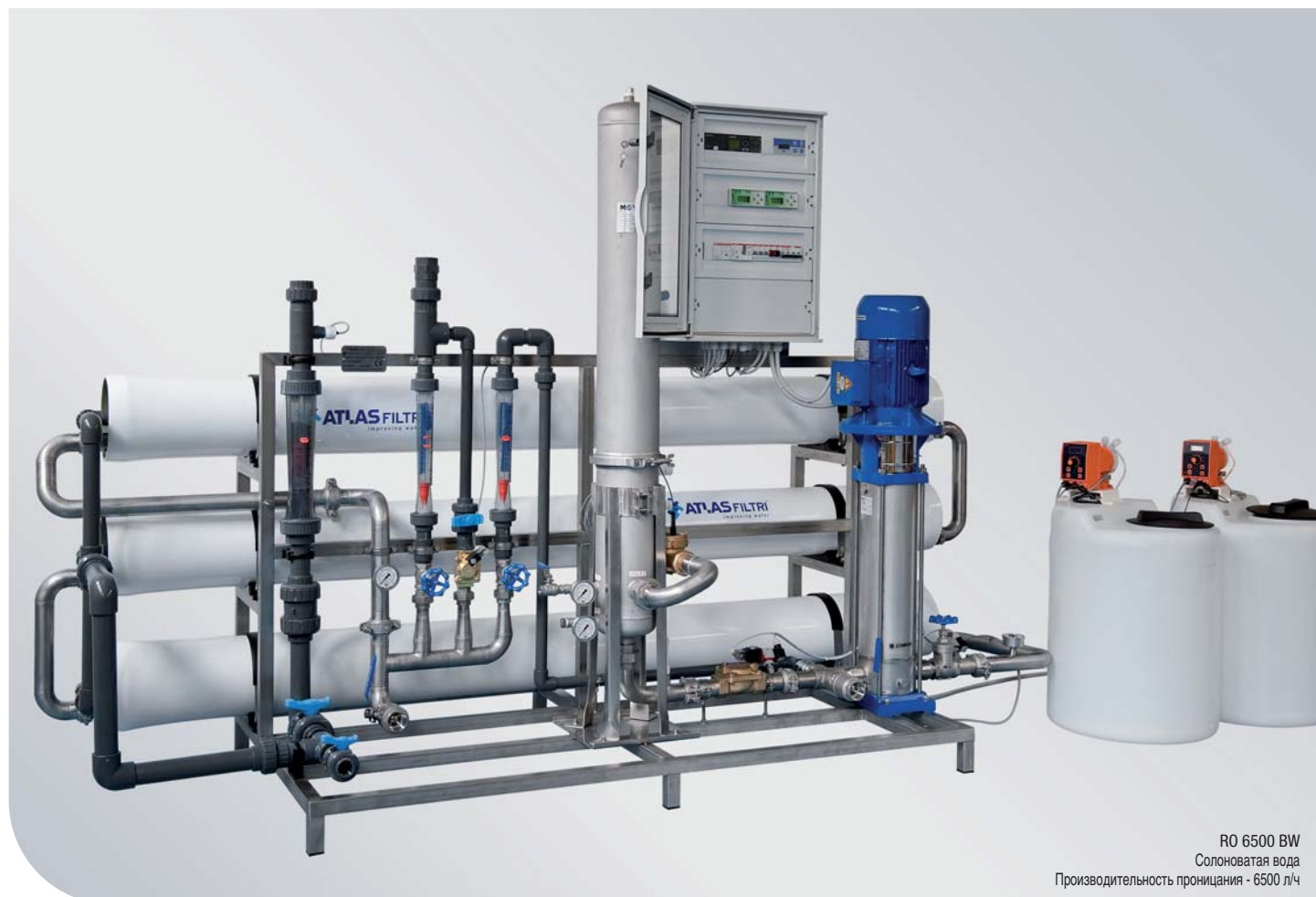
RO 6500 BW Солоноватая вода Производительность проницания - 6500 л/ч