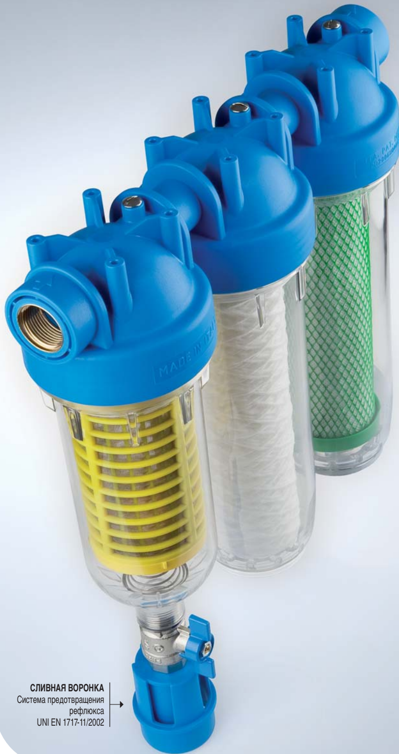
СЛИВНАЯ ВОРОНКА Система предотвращения рефлюкса UNI EN 1717-11/2002